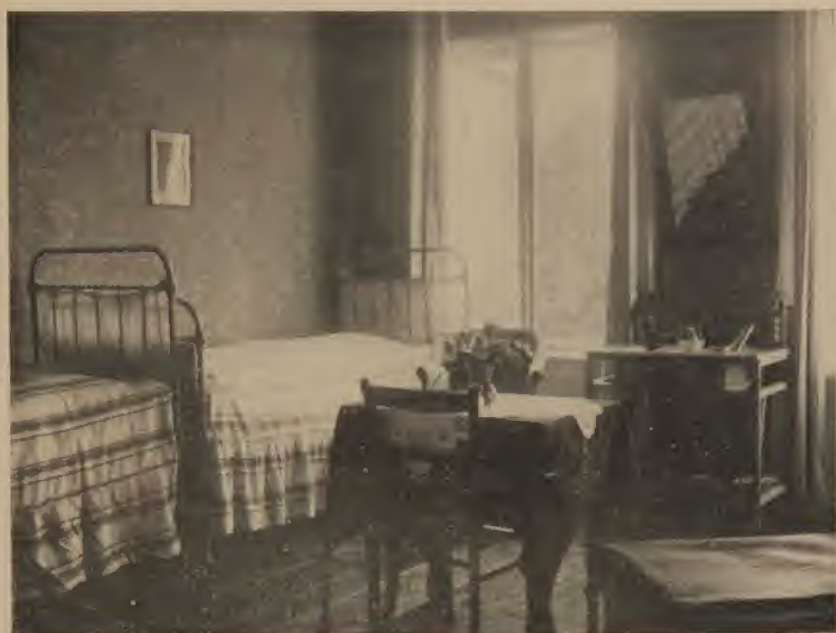
Ein Doppelzimmer im Heim für jüdische Mädchen und Frauen e. V.